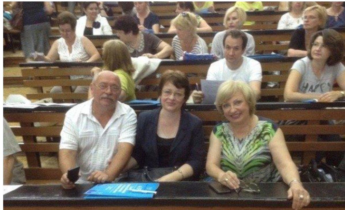
Делегаты во время работы Съезда представителей Ассоциации учителей химии (19 июля 2016 года, Московский педагогический государственный университет)