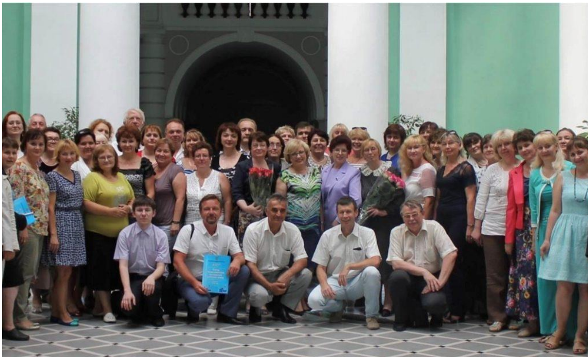
Делегаты Съезда представителей Ассоциации учителей химии (19 июля 2016 года, Московский педагогический государственный университет)