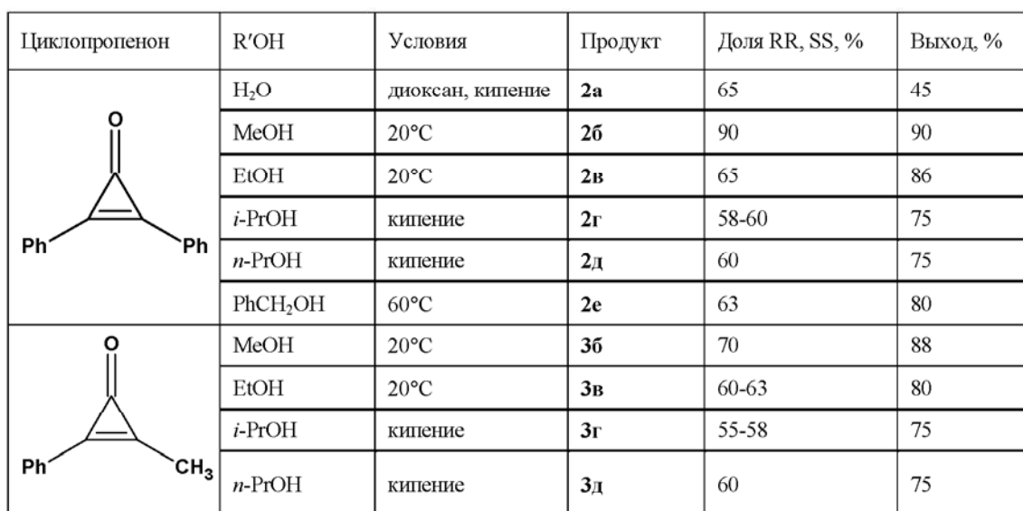
Условия реакции и состав продуктов

Эта реакция была выбрана в качестве ключевой стадии в синтезе производных \gamma -аминомасляной кислоты. Поскольку в случае использования метанола в качестве нуклеофильного растворителя выход продукта, а также диастереоселективность процесса оказываются наилучшими, соединение 2b было выбрано