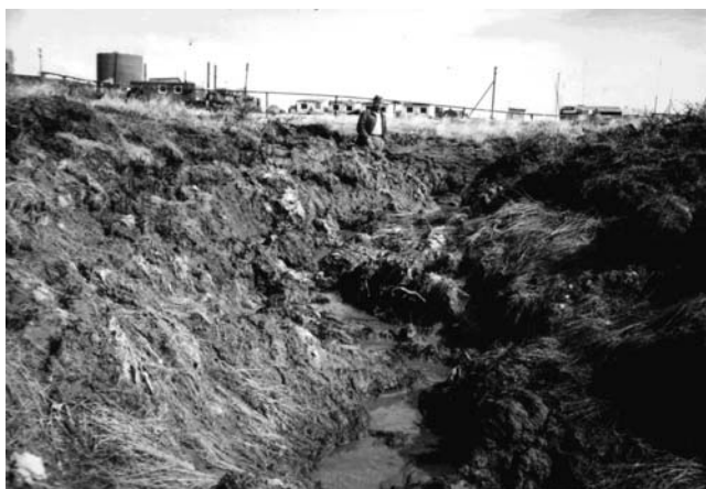
Фото 3. Активно развивающийся овраг на западной окраине вахтового поселка энергетиков (Бованенковское ГКМ, п-в Ямал)

Более крупные потоки, возникающие при снеготаянии и выпадении стокообразующих дождей, способствуют развитию овражной эрозии, представляющей собой единый процесс формирования овражно-балочной сети под воздействием постоянных и русловых потоков и склоновых процессов. Временные русловые потоки производят разрушения почвогрунтов в русле, вызывают транспорт и вынос из оврагов продуктов разрушения в ходе эрозионных, термоэрозион-