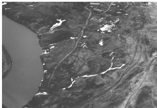
Фото 5. Развитие системы антропогенной береговой эрозии в районе вахтового поселка энергетиков (Бованенковское ГКМ п-в Ямал)

По существующим представлениям оползни-сплывы могут возникать самопроизвольно во льдонасыщенных грунтах сезонно-талого слоя после его полного оттаивания, а также вследствие нарушения теплообмена на поверхности склонов, сложенных высокольдистыми породами. Кроме того, оползни развиваются в случае подрезки оснований таких склонов как естественными эрозионными процессами, так и в ходе хозяйственного освоения территорий. В результате на склонах образуются протяженные полосы оголенного тонкодисперсного легкоразмываемого грунта, в пределах которых могут впоследствии развиваться процессы смыва и овражной эрозии.