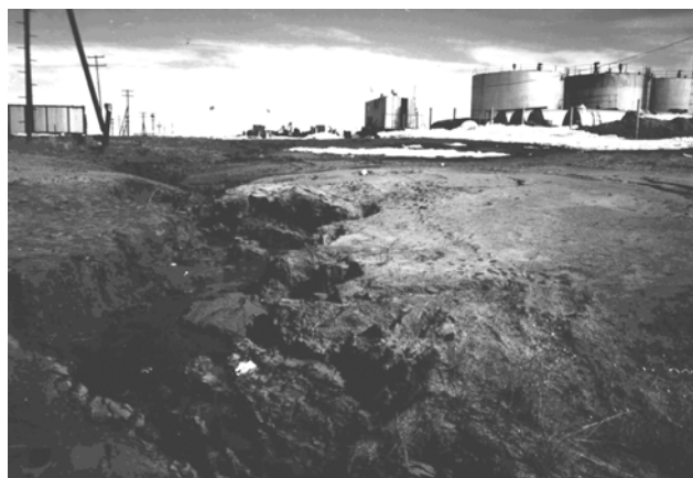
Фото 2. Эрозионная рытвина на площадке базы бурения (Бованенковское ГКМ, п-в Ямал)

уменьшения их противоэрозионной стойкости увеличивается от 2 до 130 раз на сильнонарушенных участках. Если за фоновую интенсивность смыва принять значение 0,2 т/га в год, то интенсивность возможного смыва при слабом, среднем и сильном нарушении поверхности почв соответственно составит 0,4; 0,9 и 26 т/га в год [1].