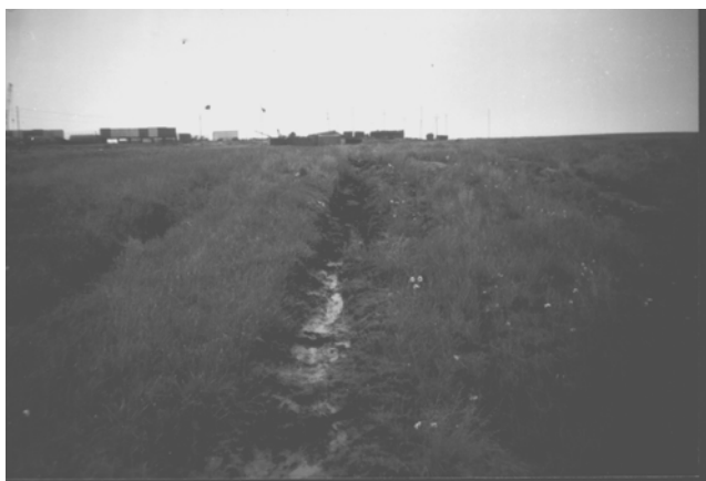
Фото 1. Начальная стадия эрозии вдоль гусеничной колеи