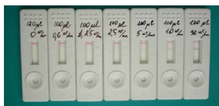
Рисунок 2. Вид готовых тест-систем для определения ПСА в сыворотке крови человека